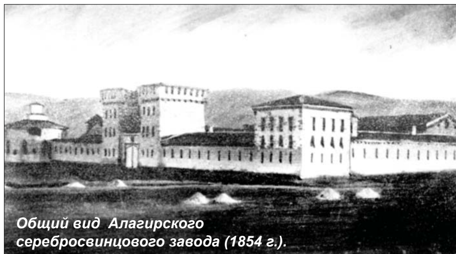
Общий вид Алагирского серебряноцинкового завода (1854 г.).

торжественное открытие серебряноцинкового завода. На церемонии присутствовал прозаик, поэт, драматург, статский советник при наместнике Кавказа граф Владимир Соллогуб. Спустя два дня, 21 мая, был получен первый слиток чистого серебра весом 26,5 фунта (около 11 кг) и 264 пуда (более 3 тонн) свинца. Первый слиток серебра был отправлен в Петербург императору Николаю I, по