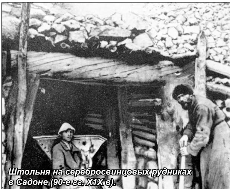
Штольня на серебряноцинковых рудниках в Садоне (90-е гг. XIX в.).

казе. После второй командировки Картерон подтвердил, что «из числа всех месторождений самым благонадежным может считаться Садонское месторождение».